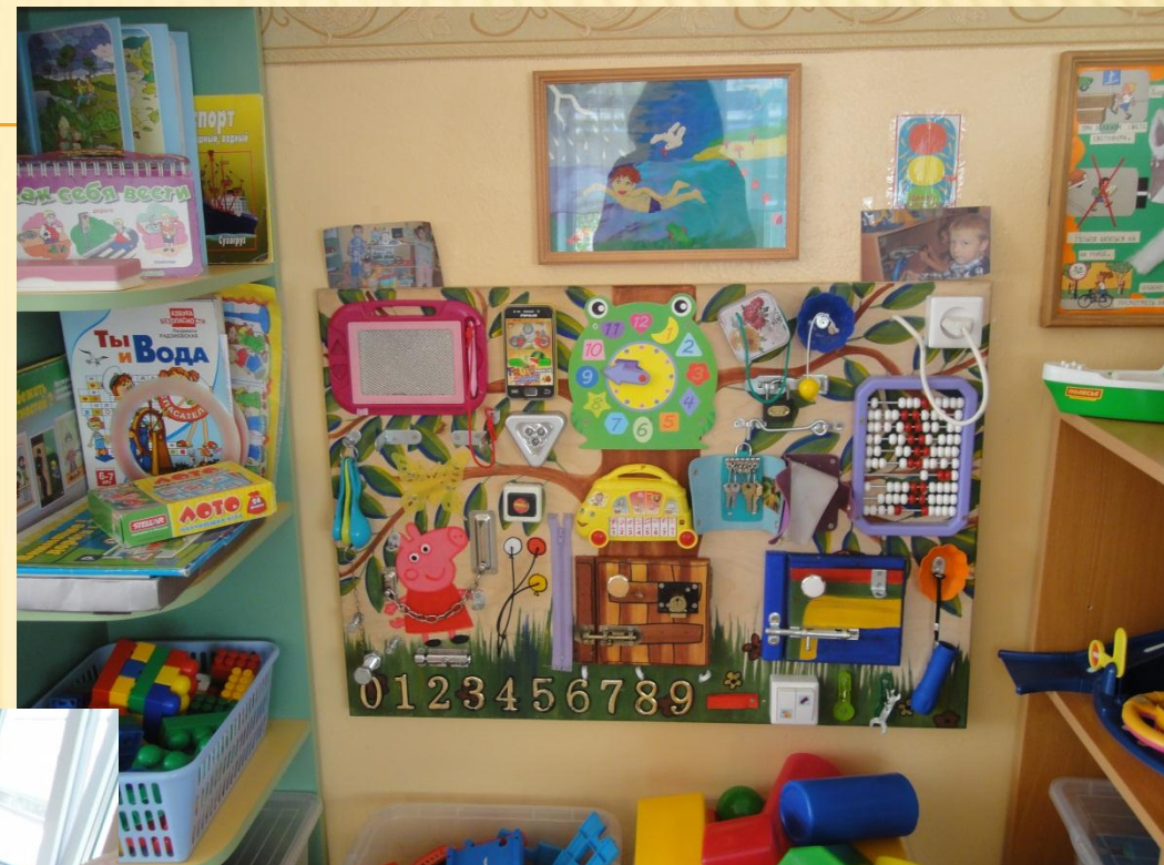
Модуль «Центр творчества»