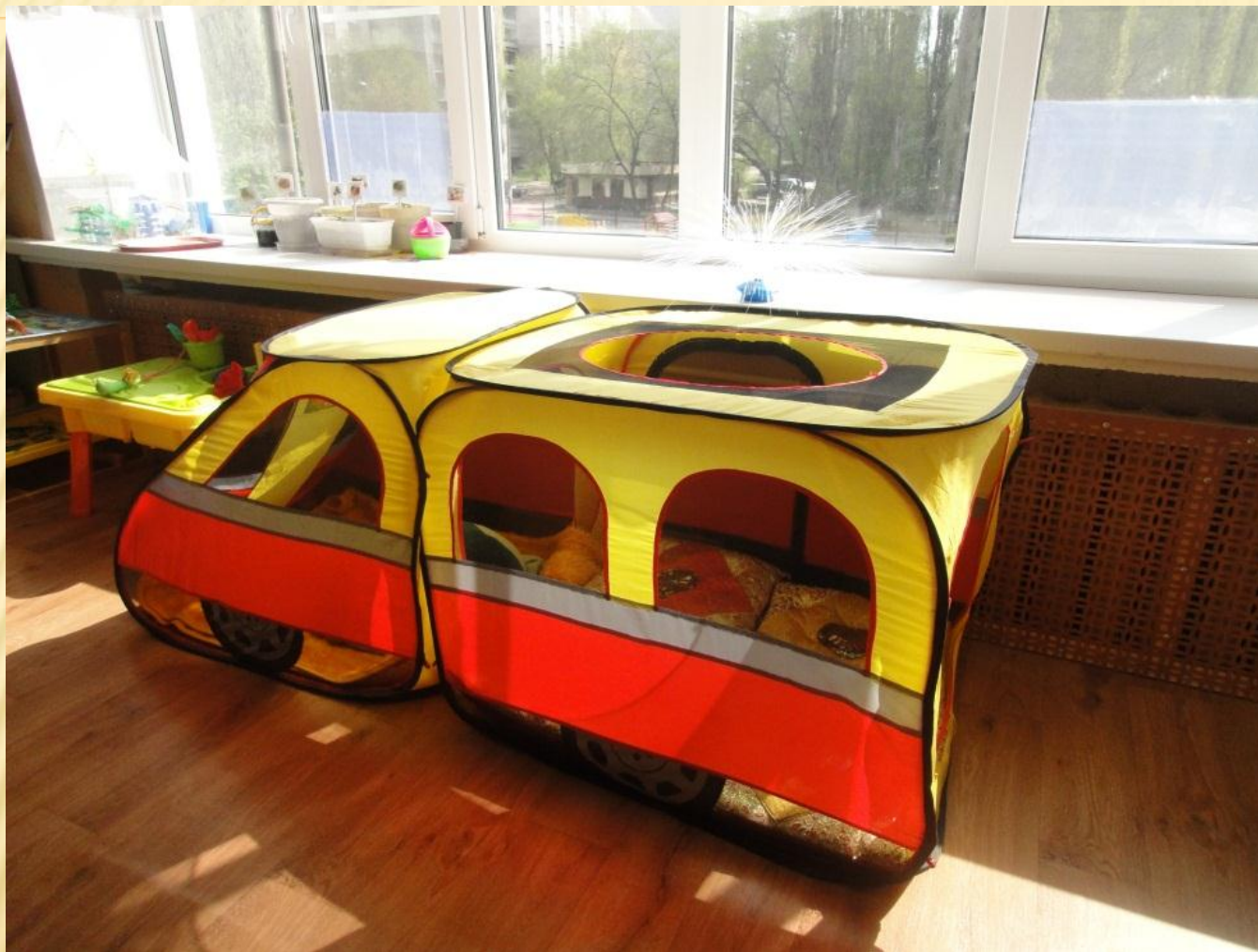
Модуль «Уголок уединения»