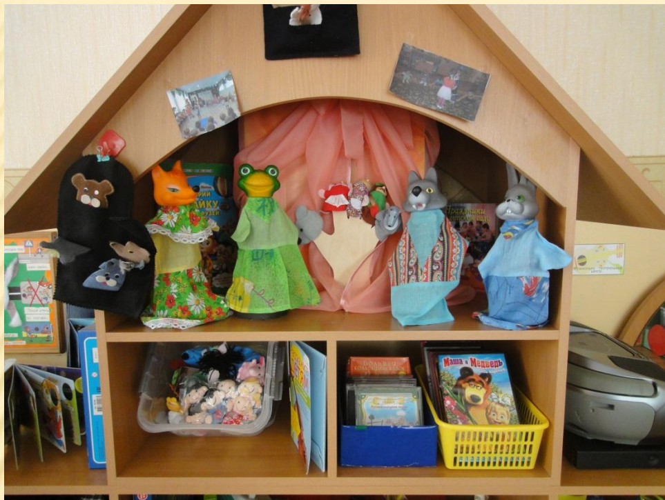
Модуль «Театральная гостиная».