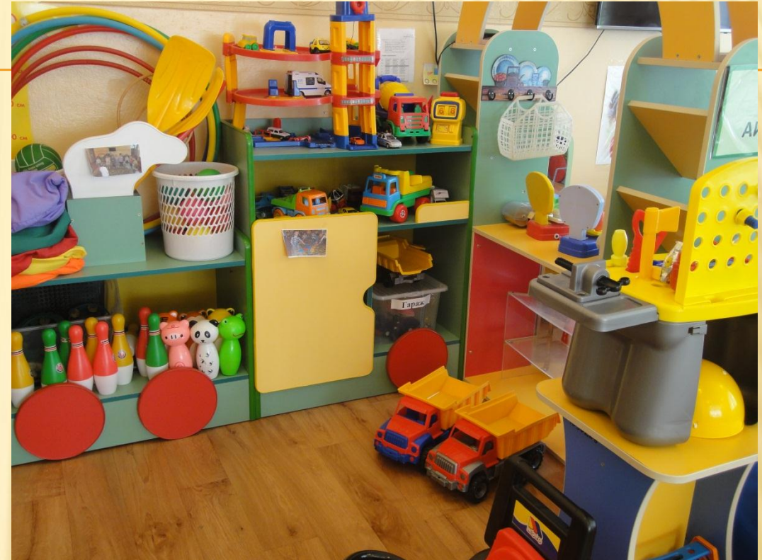
Центр сюжетно-ролевой игры Модули «Мастерская», «Заправка», «Дорожное движение»