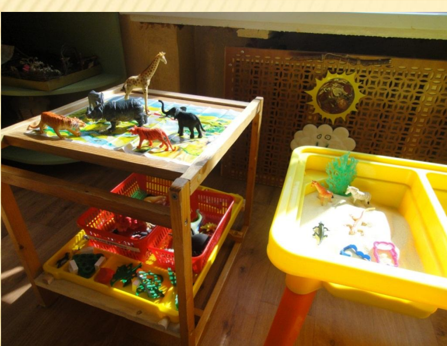
Центр Воды и песка