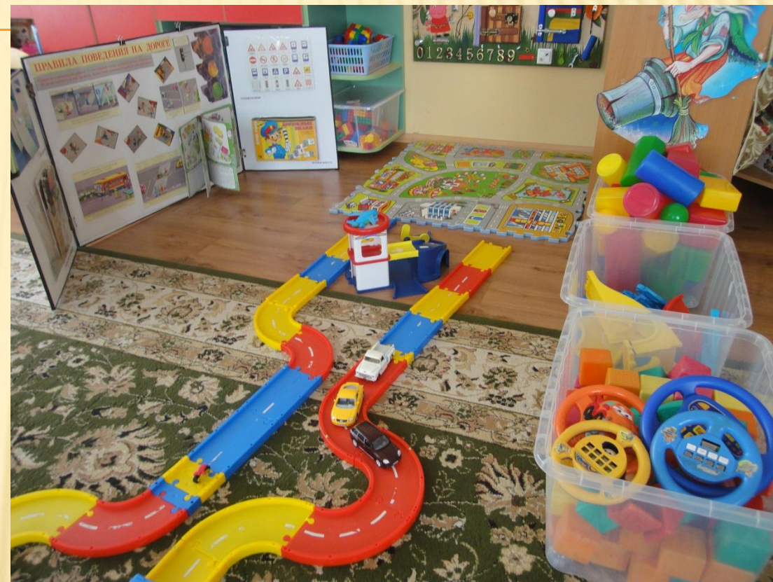
Модуль «Безопасность»; «Мой город».